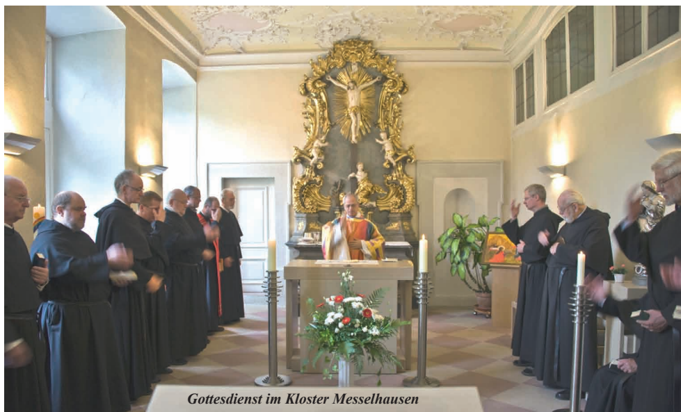
Gottesdienst im Kloster Messelhausen