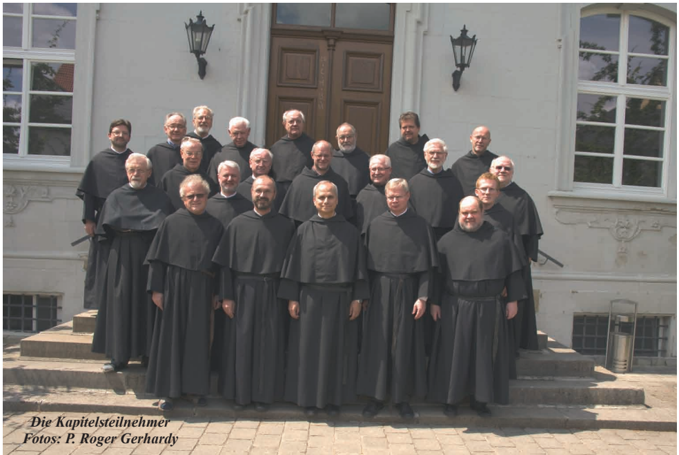
Die Kapitelsteilnehmer

Die Zukunft würde den Augustinern, so sagte er weiter, keinen Status quo bringen, sondern es sei mit viel Veränderung zu rechnen. Doch P. Alfons äußerte sich zuversichtlich, dass die Brüder der deutschen Ordensprovinz mit dem Heiligen Geist und auf die Fürsprache des Ordensvaters Augustinus gute Wege in die Zukunft gehen könnten. Einer der sogenannten kleinen Propheten berichtet davon, dass sich die Menschen einer Gruppe zuwandten, weil sie merkten, dass mit ihnen Gott ist (vgl. Sacharja 8,23). Wenn die Menschen diesen Eindruck auch von uns Augustinern bekämen, dann ist es gut. Dann gelte auch für die Gemeinschaft, was mit dem Motto des Papstbesuches in Deutschland ausgedrückt ist: „ Wo Gott ist, da ist Zukunft. “