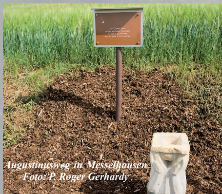
Augustinusweg in Messelhausen